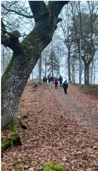
Start från Ekvallen, ut mot Torrevalladammen, elljusspåret, Alphems Arboretum och tillbaka mot Ekvallen (ca 4 – 5 km)