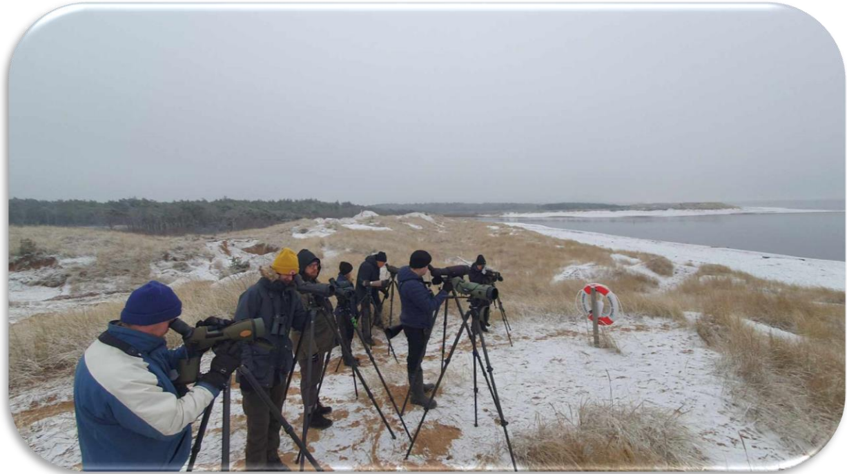
Spaning vid Lagaoset.

Vi fortsatte vidare mot Halland, där snön började falla lätt. Växlande väder – igår hade vi sol som värmdde, men idag var det snö. Vid Lagaoset fick vi syn på svarthakedoppingar och vid Trönninge ängar stannade vi för att spana, då flera av oss aldrig besökt lokalen. Vårt sista stopp var vid Larssons våtmark, där vi lyckades lägga till resans sista art, rörhöna.