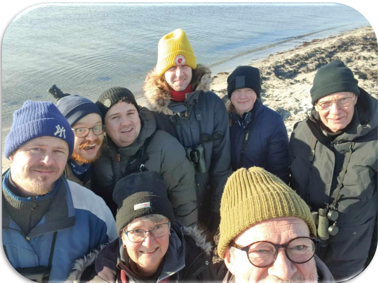
Gruppen samlad

Vår resa fortsatte till Tosteberga, där vi fick en fin upplevelse med sju storspovar som till och med spelade kort för oss. Vid Åspet fick vi syn på en snösparv och när solen tittade fram passade vi på att ta en gruppbild. På väg dit stannade vi vid en flock svanar och tittade på en mindre sångsvan som vi fått reda på gick där. Vid Yngsjö kapell dök den bruna gladan upp en kort stund, medan en flock hämplingar rörde sig över fälten.