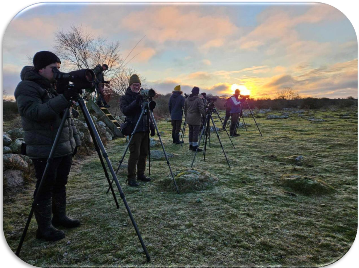
Morgon vid Kråkenabben, Blekinge.

Lördag 1 februari: Första dagen i Skåne är avklarad! Vi började morgonen i Blekinge, där vi besökte en ny lokal för oss alla – Kråkenabben. Här möttes vi av vårtecken i form av gravänder, tofsvipa och sånglärka. Därefter styrde vi kosan mot Hörviks hamn, där vi fick se åtta fjällgäss, alla märkta inom det pågående bevarandeprojektet för arten. Vill du veta mer om detta projekt kan du läsa här: https://nordensark.se/bevar.../bevarande-i-sverige/fjallgas/ .