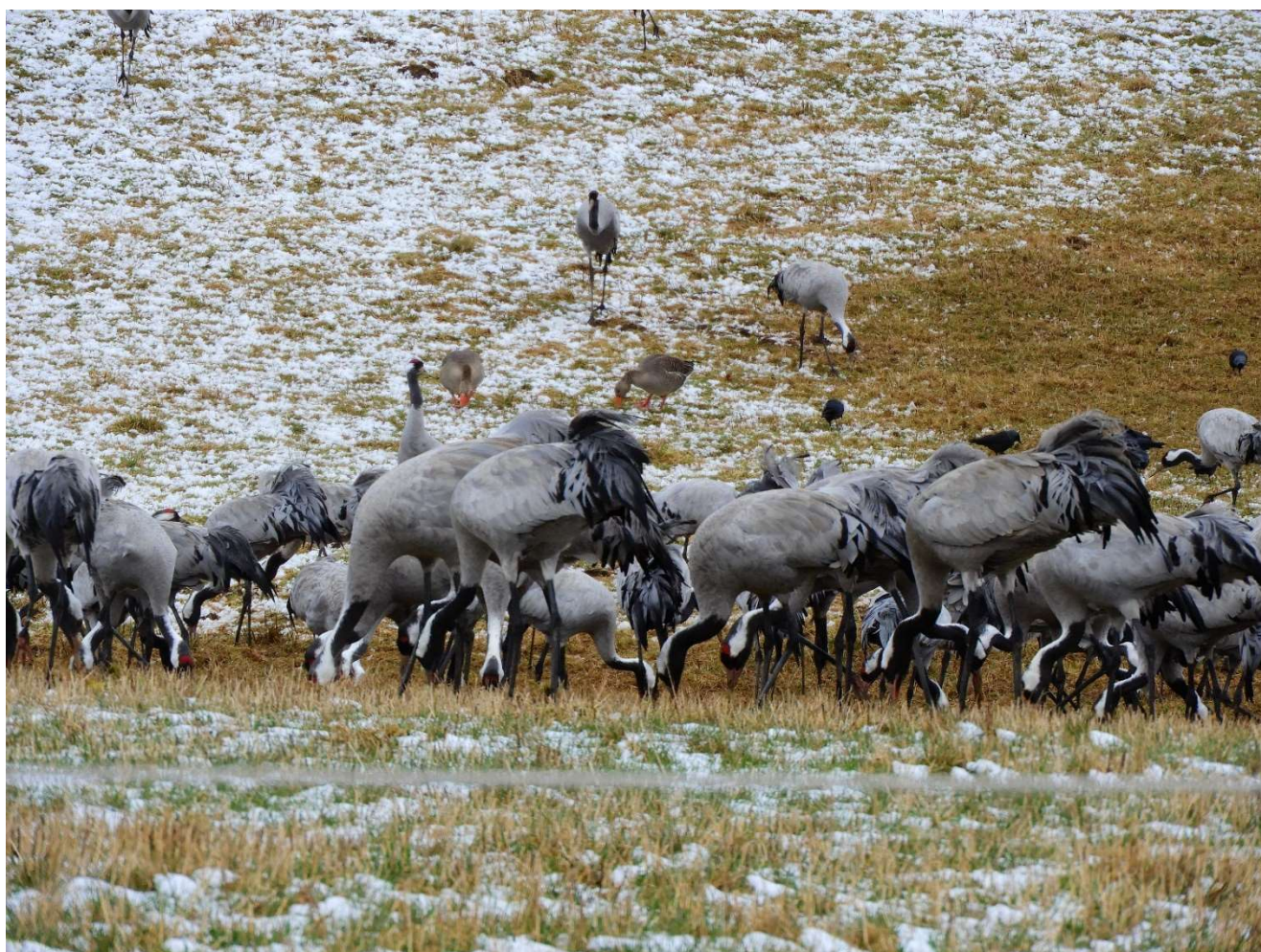
Mycket om våren vid Hornborgasjön handlar om tranorna, men det mesta hos tranorna handlar om att äta.