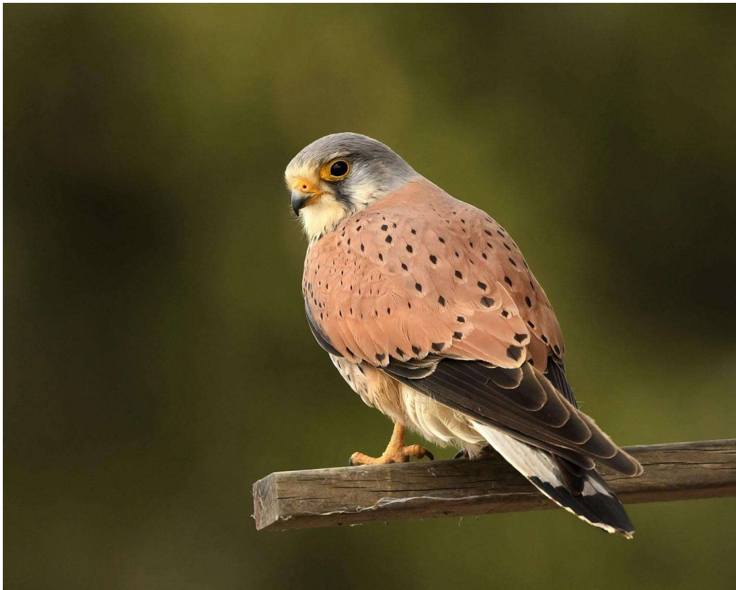
Tornfalk hane, äldre än tre år.